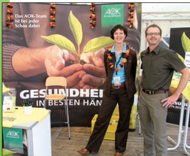
Das AOK-Team ist bei jeder Schau dabei