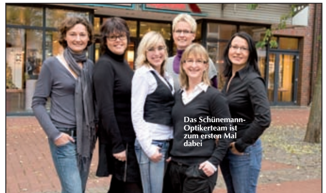
Das Schönemann-Optikerteam ist zum ersten Mal dabei